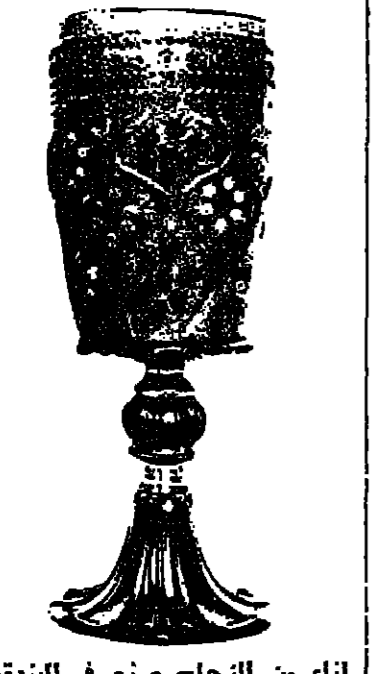
اناء من الزجاج صنع في البندقية ويبدو فيه تأثير الصناعة السوروية واضحا وان اخفقت النقوشس باللغة العربية

على كل حال لا يمكن التأكيد ان الشعر العربي القديم بشكل عام كان حسب الحركة الرومانتيكية خاصة وان الادب العربي اخذ له طابعا معينا في الفترة الحديثة فقط ما بين الحريين العامين الاولى والثانية .. لقد احس الشعراء في مصر ولبنان بالثقيد والمحاطة والوجود الادبي والاجتماعي وهذا ما جعل الرومانتيكية العربية تدعو الى الهمم والتزرة والتبريد وبناء عالم الشعر والجمال المثالي فقد احب عدد من الشعراء ان يبونوا بهدوء نتيجة الامم